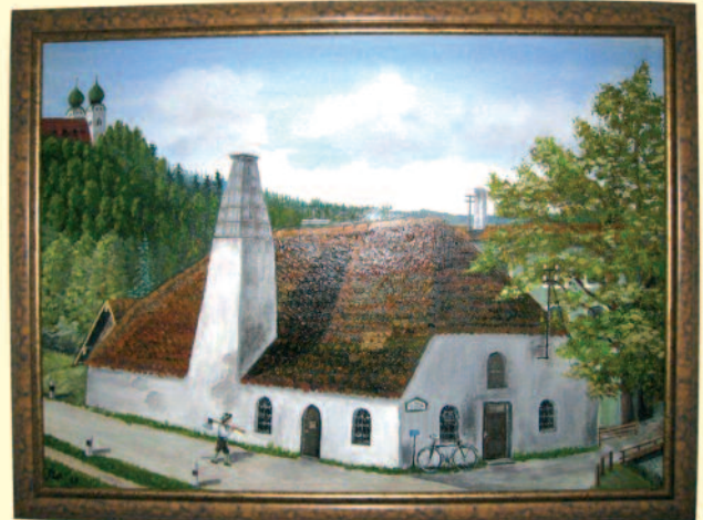
Foto: Ein Hobbymaler aus Trostberg hielt die Altenmarkter Hammerschmiede vor 1957 im Bild fest und übergab es dem Heimatmuseum

„Das Heimatmuseum Altenmarkt ist am Mittwoch, 25. Juli und Mittwoch, 1. August geöffnet. Am Mittwoch, den 8. August und Mittwoch, den 15. August, gibt es eine kurze Sommerpause. Ab Mittwoch, den 22. August ist das Museum wieder jeden Mittwoch ab 16 Uhr geöffnet. Für Feriengäste oder Familienbesuche können Führungen auch in kleinster Gruppe direkt vor Ort vereinbart werden. Das Heimatmuseum befindet sich im Schulgebäude mit eigenem Eingang. Vor dem Eingang direkt am Bürgersteig begrüßt die Besucher der Pavillon für die großen historischen Objekte der alten Altenmarkter Hammerschmiede, die 400 Jahre lang an der Stelle in Altenmarkt stand, wo im Rahmen eines Miniparks eine entsprechende Erinnerungstafel in Form eines Wasserrades an sie erinnert. In die Geschichte der Schmiede und in vieles, vieles mehr lässt sich in aller Ruhe eintauchen beim Besuch im Heimatmuseum. Infos gibt es bei Günther Stöckl, Telefon 08621/2909, bei Susanne Namberger, Telefon 08621/2890 oder bei Günther Roßmanith, Telefon 08621/2568. Der Eintritt ins Museum ist frei; für Spenden gibt es eine kleine Schatzkiste.“