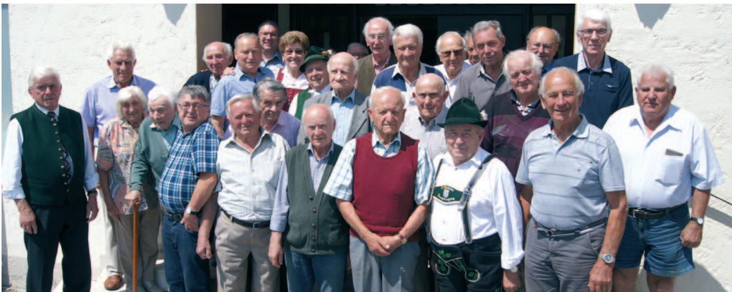
Der Männerverein Altenmarkt/Stein lud alle runden und halbrunden Geburtstagskinder zur Jubilarfeier ein.