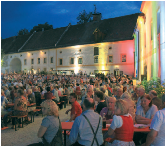
Findet heuer am 4. August im Baumburger Klosterhof statt: das Weisenblasen des Musikvereins.